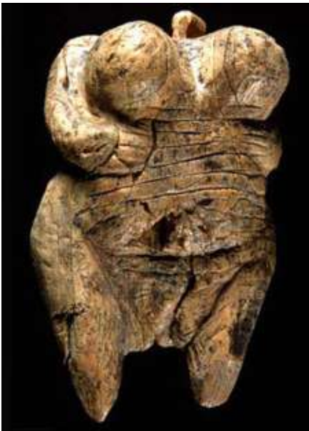
Soška objevená v září 2008 v jeskyni Hohle Fels v jihozápadním Německu. Je asi 5 cm vysoká, více než 35 000 let stará.

Věstonická venuše z pálené hlíny stará asi 30 000 let. Je 11,5 cm vysoká.